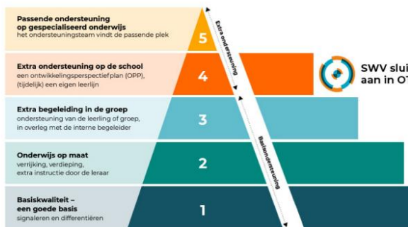
Pyramide handelingsgericht werken (HGW)

We starten altijd met wat een kind nodig heeft binnen de klas. Als dat niet voldoende blijkt, kunnen we extra hulp inschakelen, bijvoorbeeld van een intern begeleider of externe deskundige.