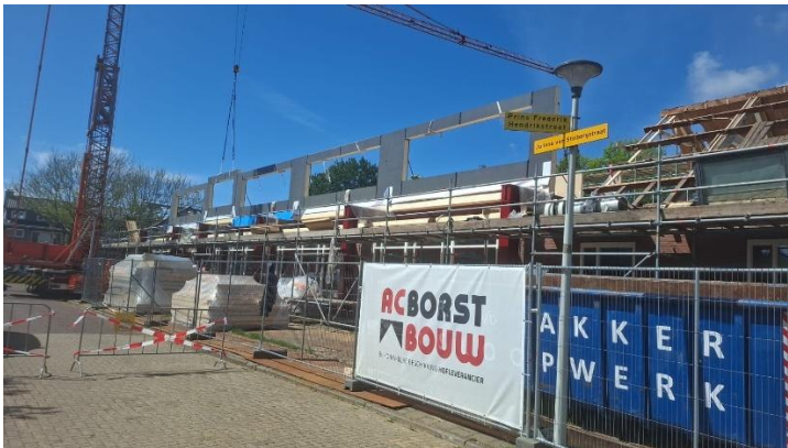
18 mei 2026 westzijde